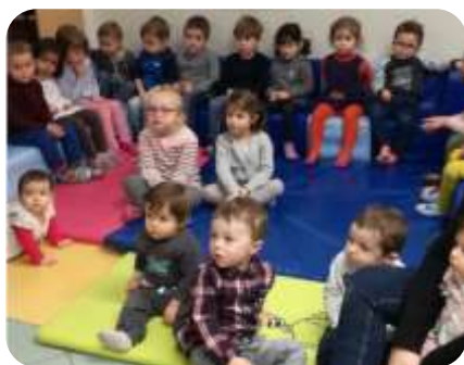
Lecture de contes à l'école maternelle

15 assistantes maternelles y ont participé accompagnées de 41 enfants .